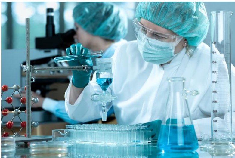
Экстракция. ЗАО "Эвалар"