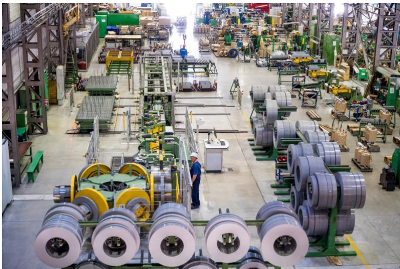
Линия поперечного раскроя электротехнической стали. АО "Алтранс"

На предприятиях, где были созданы эталонные участки, удалось добиться сокращения времени протекания процессов в 2,1 раза, увеличения выработки на одного сотрудника в 1,5 раза, а также сокращения запасов незавершённого производства в 3,1 раза.