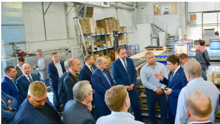
Заседание Правления Союза промышленников Алтайского края на Барнаульском заводе АТИ Экскурсия по заводу

В рамках деятельности Союза промышленников Алтайского края в 2023 году были также организованы круглые столы, посвященные важным для региона темам. Основные обсуждаемые темы включали: