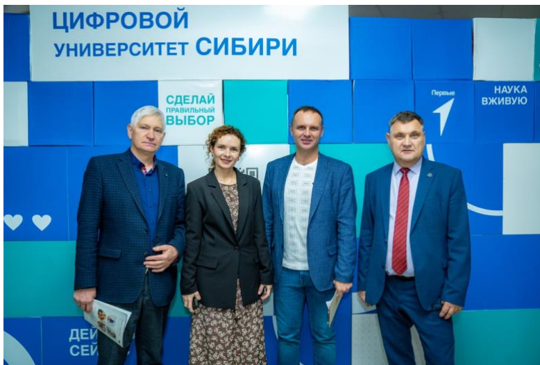
На Форуме будущих инженеров Алтая в АлтГТУ

На мероприятиях были организованы образовательные шатры и выставочные стенды предприятий, благодаря чему молодежь могла ознакомиться с актуальными тенденциями на рынке труда и направлениями профессионального развития.