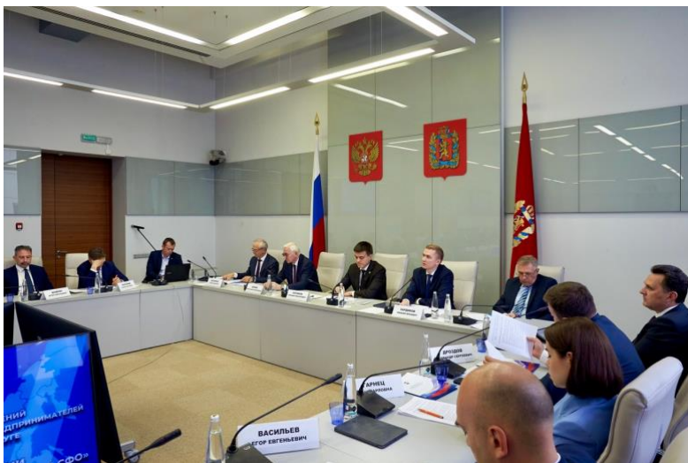
Координационный совет РСПП, Красноярск, июнь 2023

В 2023 году Союз промышленников Алтайского края продолжил активное взаимодействие с РСПП, осознавая, что решения многих проблем промышленных предприятий находятся на федеральном уровне. Будучи региональным отделением РСПП, Союз имеет возможность транслировать предложения и инициативы регионального бизнес-сообщества на федеральный уровень. Союз промышленников направил ряд предложений по развитию экспортной деятельности, внедрению "Регионального инвестиционного стандарта" и стабилизации цен на металл.