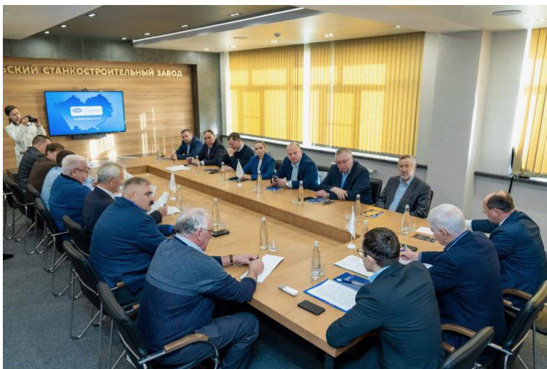
Заседание Правления Союза Промышленников Алтайского края на Барнаульском станкостроительном заводе

Участие представителей Союза промышленников Алтайского края в деятельности упомянутых структур обеспечивает эффективный канал для передачи позиций и интересов делового сообщества непосредственно органам исполнительной власти. Это позволяет не только обсудить важные вопросы, но и сформировать квалифицированное экспертное мнение по обсуждаемым темам.