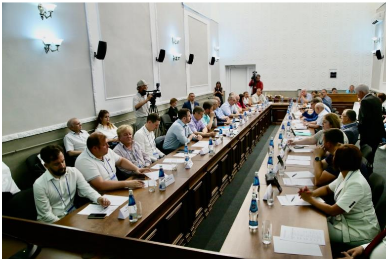
Форум "Сибирский промышленник", Барнаул, июль 2023

В 2023 году состоялись две встречи под названием форум "Сибирский промышленник". Первый форум прошел 12-13 июля в Барнауле, на территории Алтайского завода прецизионных изделий, второй - 25-27 октября в Новосибирске. События собрали ведущих промышленников из шести регионов Сибирского Федерального округа. Основной акцент на встречах был сделан на обсуждении актуальных проблем и вызовов, с которыми сталкиваются промышленные предприятия Сибири в текущей экономической ситуации.