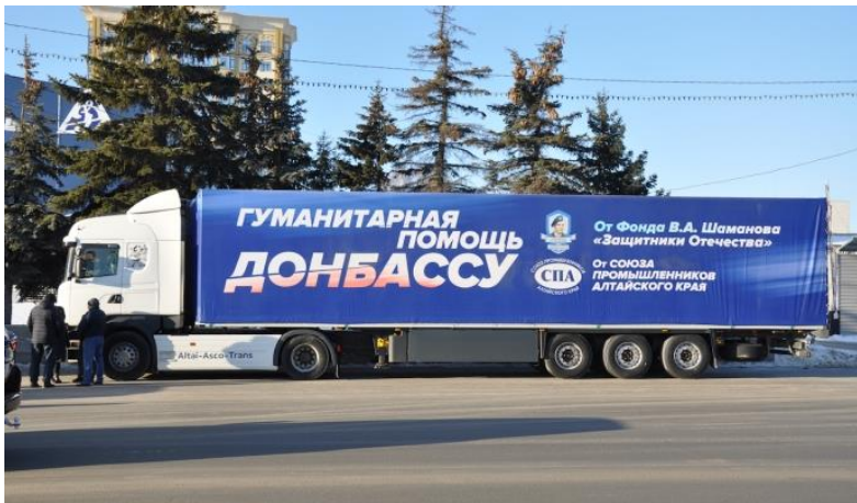
К Дню защитника Отечества в зону СВО отправлено 68 тонн гуманитарного груза

Одной из важных сторон деятельности Союза промышленников Алтайского края является участие в социальных проектах и благотворительной деятельности.