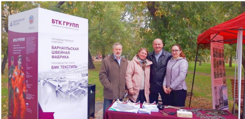
Фестиваль рабочих профессий "Заводская проходная"

консолидация усилий всех участников рынка труда для обеспечения экономики края квалифицированными кадрами.